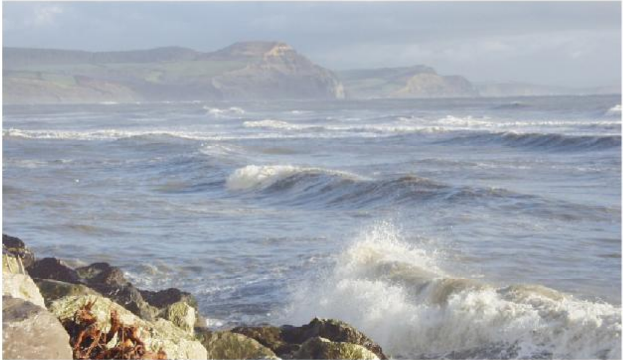
Blick auf Golden Cap und Lyme Bay, von Lyme Regis Harbour aus gesehen. View from Lyme Regis Harbour towards Golden Cap and Lyme Bay.