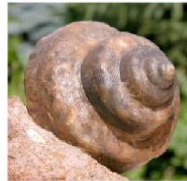
Cf. Pl. armata var. precatória, Desl. Bajocium, Kinding, \varnothing 80 \times H 74 mm A form without clearly raised nodes; but there might exist sufficient transitions to call it just variability. Eine Form fast ohne abgesetzte Knoten. Mir ist nicht bekannt, ob ausreichend Übergangsformen bekannt sind, um diese Form durch Variabilität zu erklären.