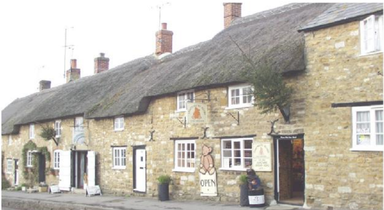
Das Teddy Bear House in Abbotsbury, Museum und Ladengeschäft. The Teddy Bear House in Abbotsbury. museum and shop.