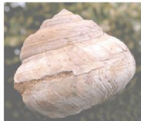
Pleurotomaria sp., Kimmeridge, Tulear, Madagascar, \varnothing 80 \times H 74 mm. No similar form with clear determination known to me. Ich kenne keine beschriebene Art dieser Form.