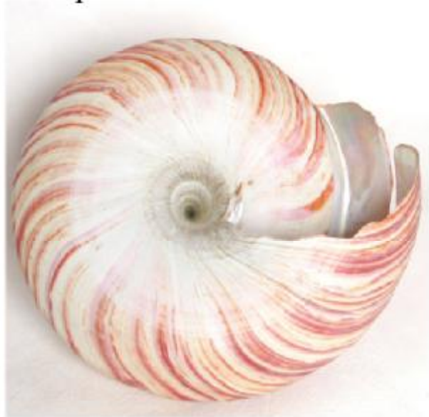
Entemnotrochus rumphii , ø198 x H157mm, Tiao Yu Tai Island, Taiwan. Strong colour and size over average. Kräftige Farbe und überdurchschnittliche Größe.