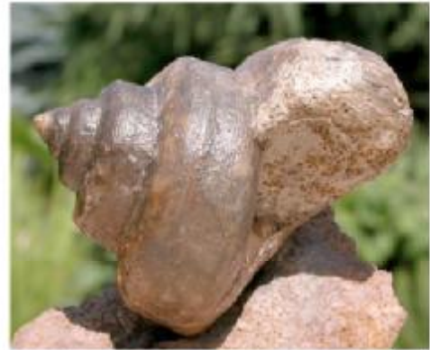
Pleurotomaria sp., Tulear, Madagascar, Kimmeridge; Left: \varnothing 82 \times H 59 mm Right side: \varnothing 56 \times H 49 mm; Not a Bathrotomaria, because the slit is clearly not at the ramp angle located. - Keine Bathrotomaria, weil das Schlitzband eindeutig nicht auf dem Knick der Rampe liegt.