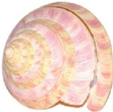
Entemnotrochus rumphii , ø81 x H63mm, HaiNan Isl.

Neat small specimen with typical yellow apex colour.