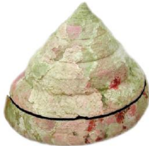
Entemnotrochus rumphii , ø191mm, North Taiwan Sea. Uncleaned specimen - Unpräpariertes Exemplar