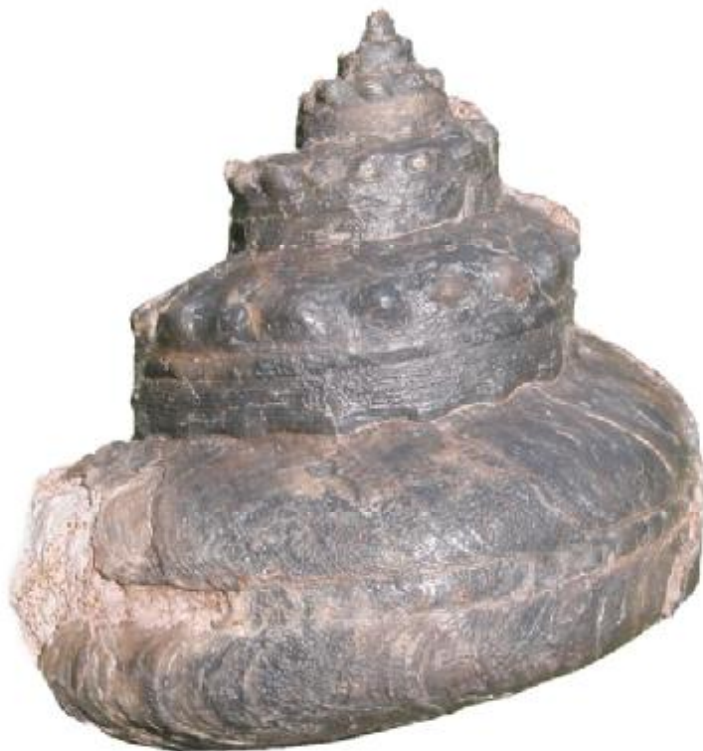
Cf. Pl. armata var. precatória, Desl., Bajocium, Kinding, \varnothing 113 \times H 125 mm, Form with clearly distinguished nodes on the first whorls. Erste Windungen deutlich beknotet.